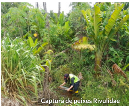
Captura de peixes Rivulidae