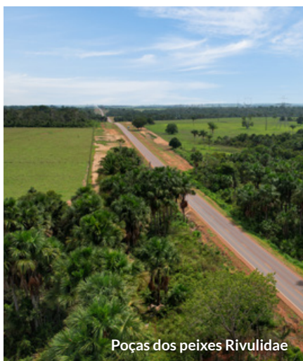
Poças dos peixes Rivulidae

Você sabia que os peixes da família Rivulidae possuem um ciclo de vida bem curioso? Durante a época das chuvas, os adultos são encontrados em poças temporárias onde deixam seus ovos. Durante a época da seca, essas poças secam, os adultos morrem e os ovos ficam “adormecidos” até a próxima estação chuvosa, quando eclodem. Por parecer que surgem “do nada” nas poças, acreditava-se que esses peixes caíam do céu junto com a chuva. Temos um programa ambiental que busca conhecer e preservar esses peixes em localidades próximas de nossas atividades, pois muitas das espécies já estão ameaçadas de extinção.